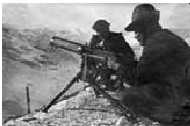
Alpini sul Grappa