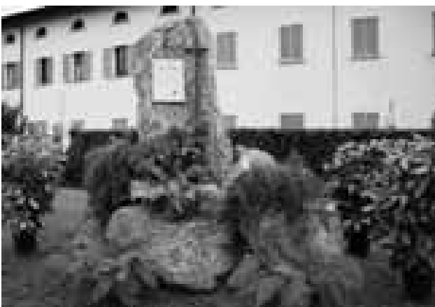
Osnago - Il cippo nel parco Mantovani

Domenica 31 Agosto il Gruppo ha ripristinato la celebrazione della Santa Messa in quota al bivacco dedicato all'indimenticato presidente nazionale Ugo Merlini in Grigna. Questo grazie al giovane sacerdote don Marco di Oggiono che è salito ben volentieri nonostante il tempo non bellissimo ed ha celebrato una sentita Eucaristia. La giornata di festa è poi proseguita presso il rifugio Pialleral con un ottimo pranzo in allegria. Il destino ha poi voluto che anche domenica 14 Settembre, giorno della Festa Annuale in Cornisella, il tempo fosse inclemente. La pioggia battente caduta fin dalle prime ore della mattina ha in parte rovinato la manifestazione. Nonostante ciò un buon numero di pasturesi e amici della Valsassina in rappresentanza degli altri Gruppi hanno raggiunto la località montana. Anche una rappresentanza della banda locale è intervenuta per allietare la festa. Il programma prevedeva la gara podistica Pasturo - Cornisella che ha riscontrato una discreta partecipazione e numerosi e ricchi premi offerti da persone del paese in memoria di loro cari deceduti. A seguire la S. Messa alla Chiesetta celebrata da don Leone in ricordo ai caduti delle guerre e agli alpini "andati avanti". La giornata è proseguita con il lauto rancio alpino ovviamente al coperto. Nel pomeriggio si sono svolti gli immancabili giochi, lotterie e incanti. Un gruppo di persone ha poi