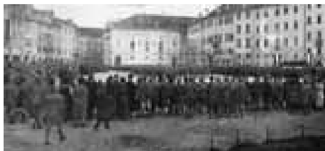
Novembre 1918 - Belluno liberata