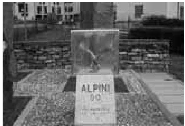
Valmadrera - L'aquila è tornata