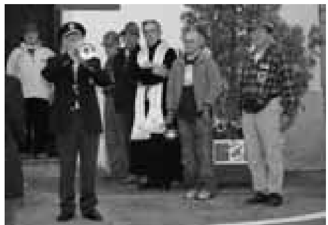
Cremono - Alzabandiera