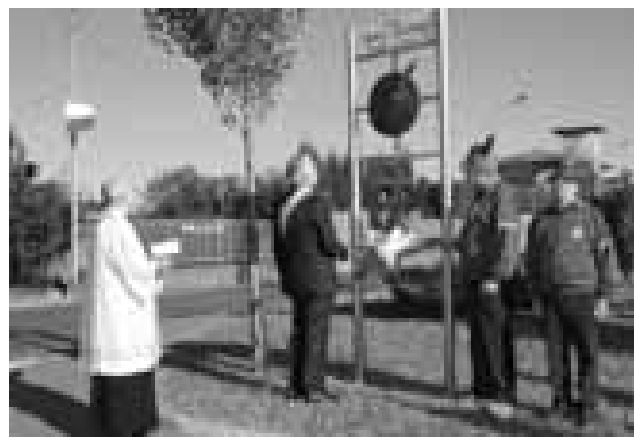
Merate - Via degli alpini