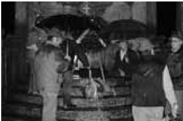
Valmadrera - La cerimonia del 3 novembre