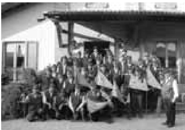
Oggiono - Gli alpini al raduno del 2° Rgpt

E non possiamo dimenticare le gioiose mattinate delle nostre