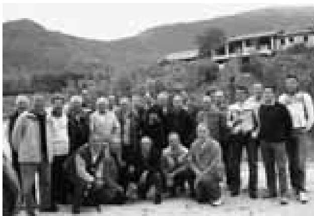
Coro Adda in gita