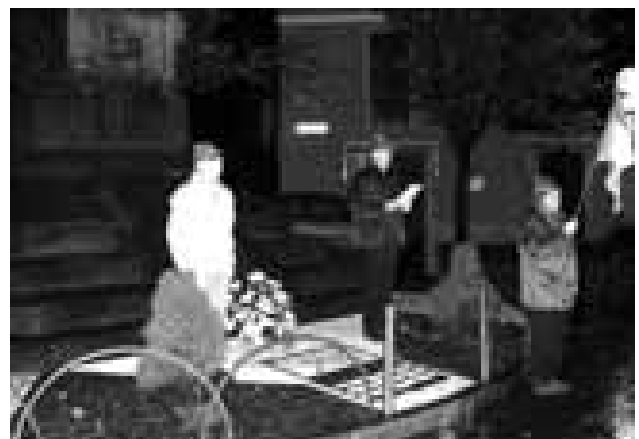
Oggiono - La cerimonia del 3 novembre