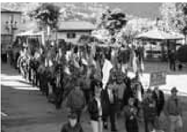
Cremono - Il corteo