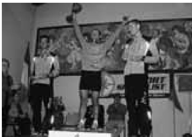
Il podio del Trofeo "F.lli Tizzoni"

La sezione prega i gruppi di inviare in Sede per tempo le notizie relative a manifestazioni sportive organizzate durante il 2008 per partecipare all'assegnazione del Trofeo "UGO MERLINI".