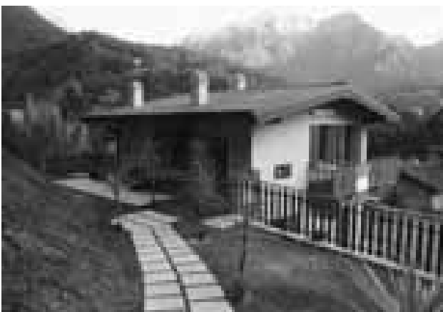
Rancio Laorca - La nuova sede