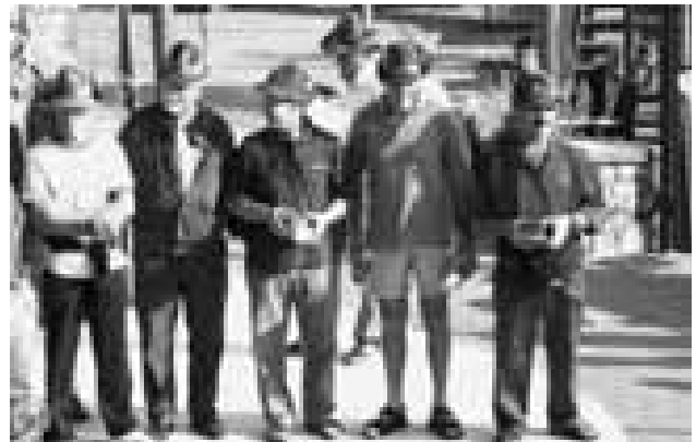
I nostri atleti