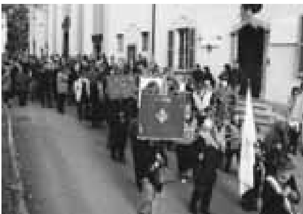
Malgrate - Il corteo

Questa è la frase scolpita sulla pietra "ALTARE" o "CIPPO" a ricordo di chi, con noi, ha lavorato e... poi è andato avanti. Da qui all'inaugurazione della "CASA VACANZE OASI DEGLI ULIVI" di Cisternino, provincia di Brindisi, intitolata a due nostri soci che con noi realizzarono parte della costruzione. Il gruppo alpini di Mandello del Lario nell'occasione di un evento così importante lancia un