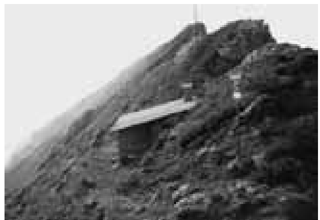
Pasturo - Il bivacco Ugo Merlini in Grigna