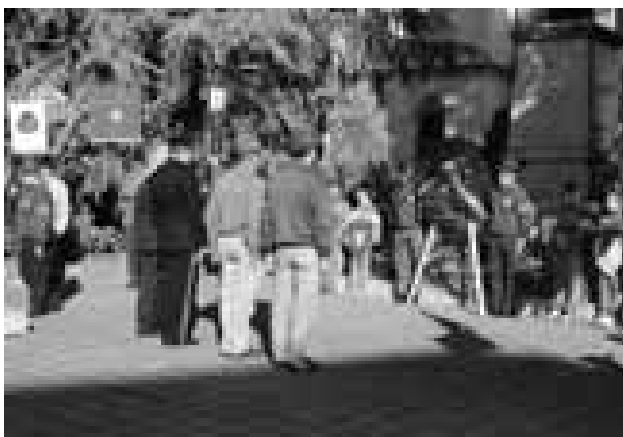
Merate - Onore ai Caduti

Comincia così la storia del Gruppo di Merate. Dapprima sommessamente, il primo raduno è del ’32, qualche segno di risveglio nel ’46, dopo gli eventi bellici, poi, a partire dal ’62, sempre più presente: manifestazione per il ritorno di salme di caduti in Albania, il raduno “Alpini della Bassa Brianza” per il 35° di fondazione, a favore dei “Mutilatini di don Gnocchi”, del rifugio Cazzaniga, per il 50° anniversario della fine della Grande Guerra. Nel ’71 inaugurazione della via don Carlo Gnocchi; poi l’impegno per la gestione del rifugio “Cazzaniga-Merlini”; nel ’76 una manifestazione per i terremotati del Friuli, fino al ’78 per il 50° di fondazione del gruppo. Da questo momento in poi si consolida l’attività del gruppo, partecipazione alle adunate nazionali, ai raduni sezionali, gite escursionistiche e culturali e le sagre dell’uva a