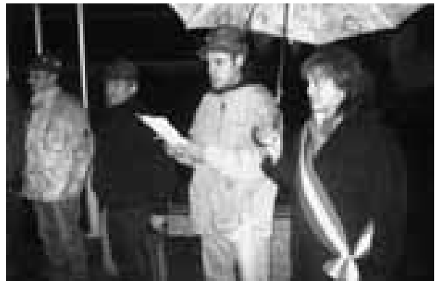
Verderio - La cerimonia del 3 novembre