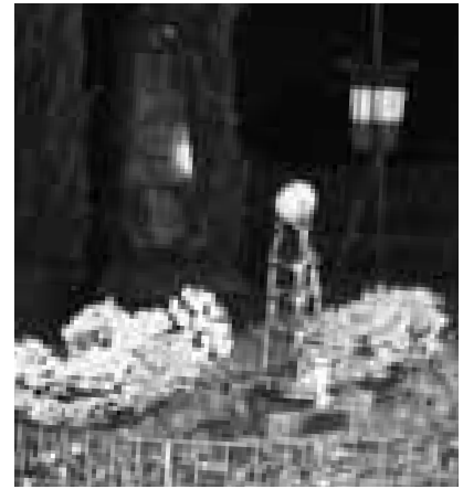
Olgiate Calco - Un lume, un fiore

Riesce a regolare la sua posizione di cittadino esentato dal servizio militare come lavoratore della Breda; a quell'epoca i lavoratori di