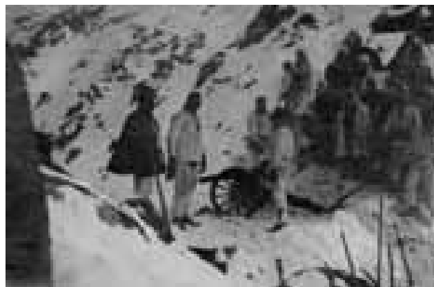
Postazione d’artiglieria Alpina