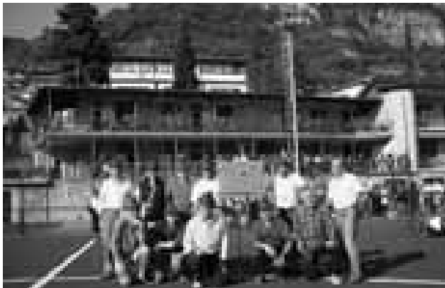
Gruppo atleti con vessillo

Ricordiamo che in un non lontano passato questa disciplina era stata dominata dalle nostre pattuglie: 1986 a Botticino, 1987 a Bassano del Gr., 1988 a Vezio di T., 1989 a Galbiate. La sezione è e sarà sempre orgogliosa dei propri atleti che onorano con impegno e sacrifici qualsiasi tipo di sport praticato.