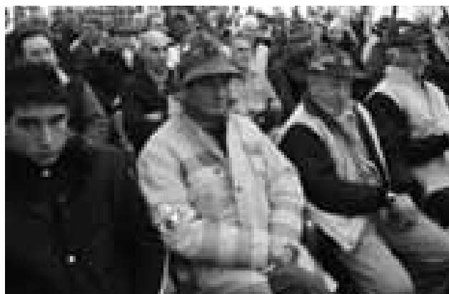
I volontari in assemblea

Nell'ambito dell'esercitazione organizzata dalla Provincia di Lecco "Fiumi sicuri 2008", abbiamo dato la disponibilità ad intervenire sull'asta del torrente Varrone, operazioni che si svolgeranno dal lago fino alle ultime case di Dervio. Con il Comune di Pagnona abbiamo organizzato un'uscita per sistemare il tratto di strada mulattiera parzialmente franata che conduce alle cascate di Gianello, opere da eseguire prima dell'inverno. Sempre a Pagnona, in primavera dovremo intervenire all'Alpe di Campo e di Vesina, per la sistemazione ed il risanamento di alcuni tratti di terreno con smottamenti in essere. Con il Comune di Bellano abbiamo in programma alcuni interventi: il primo, da eseguire quanto prima lungo la strada che conduce ad Oro, in località Verginate; in primavera è previsto una seconda operazione sulla strada mulattiera che da Crotto Porta sale verso Pegino. E' in fase di stipula la convenzione con l'Amministrazione Provinciale di