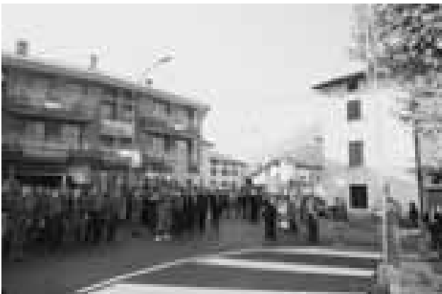
I partecipanti alla manifestazione